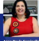
Anna Paula Feminella Secretária Nacional dos Direitos da Pessoa com Deficiência VER MAIS